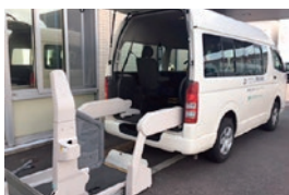
通所リハビリテーション 西堀