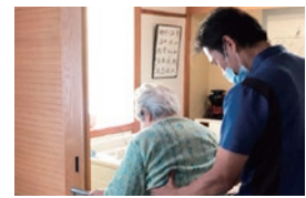
訪問リハビリテーション 西堀