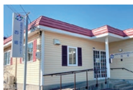
地域包括支援センター 西堀