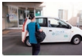
訪問看護ステーション 西堀