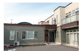
地域包括支援センター 神山